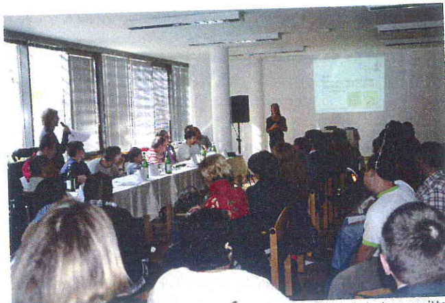
Die Inhalte des Mitsprachekatalogs wurden von den SelbstvertreterInnen mittels einer PowerPoint-Präsentation vorgestellt.